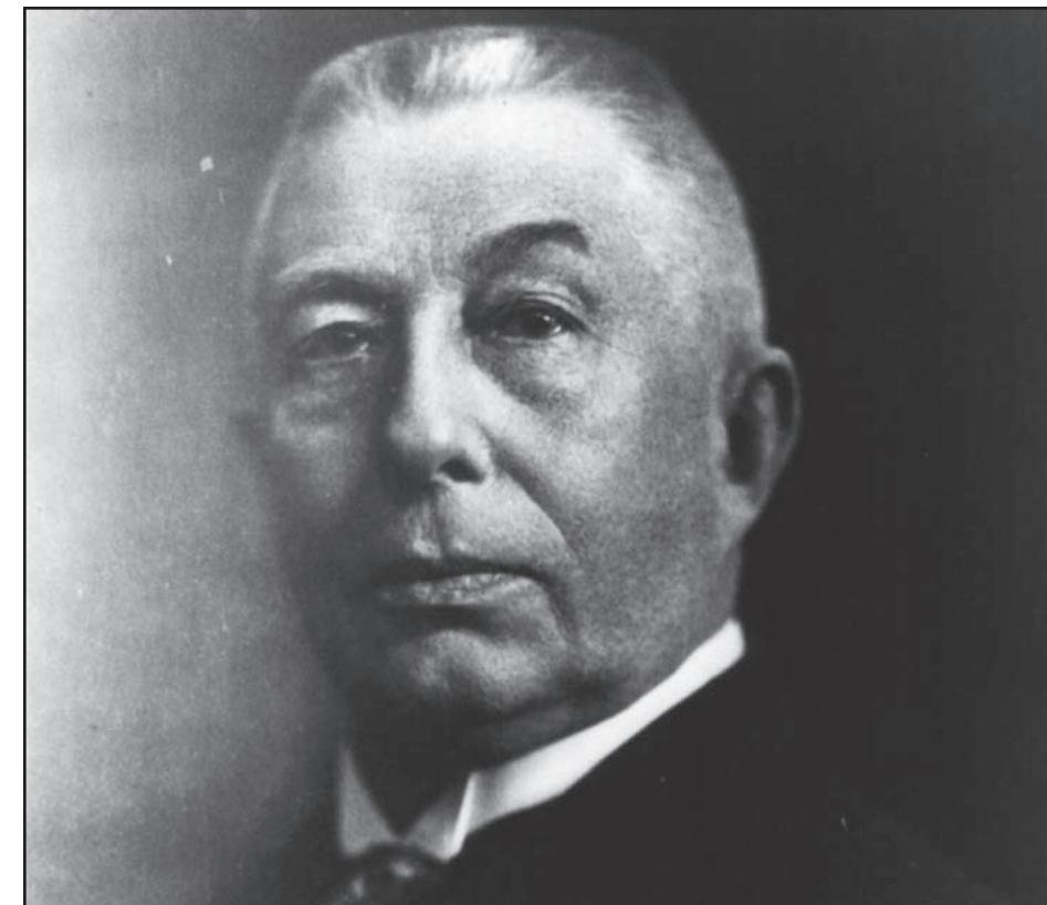
Hendrikus Colijn (1869 - 1944)